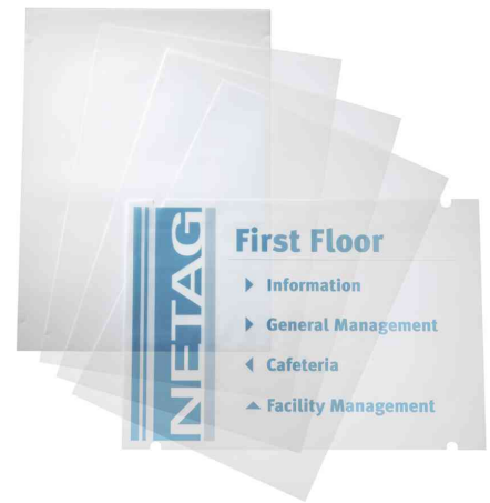
Zubehör: Folien CRYSTAL SIGN refill