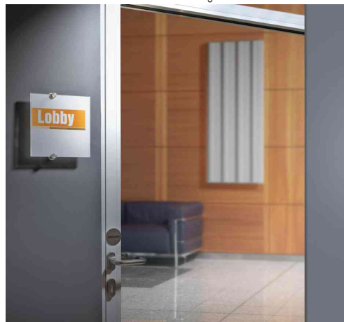
Türschild CRYSTAL SIGN, Anwendungsbeispiel