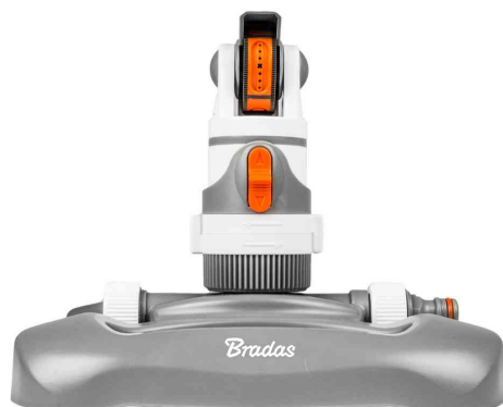
Kreisregner WHITE LINE, 4 Funktionen &amp; Standfuß

- zur Beregnung von mittleren bis großen Flächen