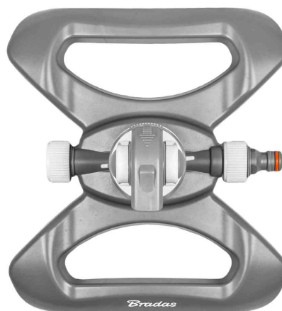
Kreisregner WHITE LINE, 4 Funktionen &amp; Standfuß