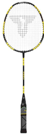
Badmintonschläger ELI TEEN - Rückhand