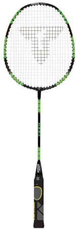
Badmintonschläger ELI TEEN - Vorhand