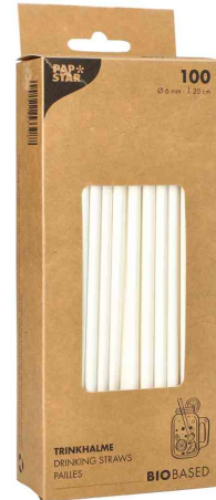
Papier-Trinkhalme "pure" weiß, in Kartonbox