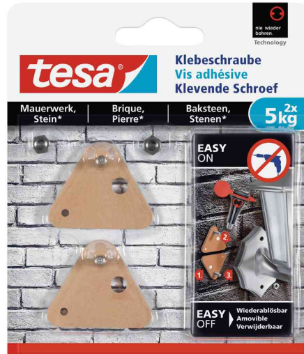
Klebeschraube - für Mauerwerk & Stein, 2 x 5,0 kg