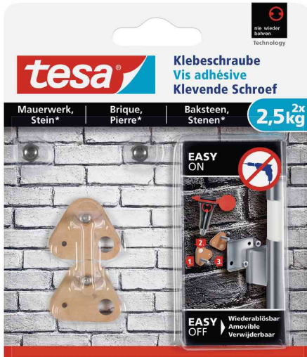
Klebeschraube - für Mauerwerk & Stein, 2 x 2,5 kg