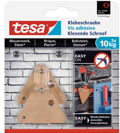
Klebeschraube - für Mauerwerk & Stein, 2 x 10,0 kg